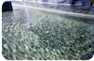
从地中自然涌出的水源