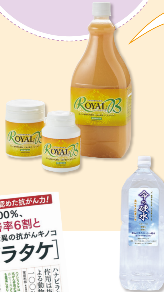
「健康365」6月号に掲載されました。

こちらのエキスを体調・症状にあわせて摂取していただくために、ドリンク・カプセルの2種類にしました。ラベルに記載しているお召し上がり方・保存方法を目安に摂取してください。(全て自然食品なので摂取しすぎても問題ありません)