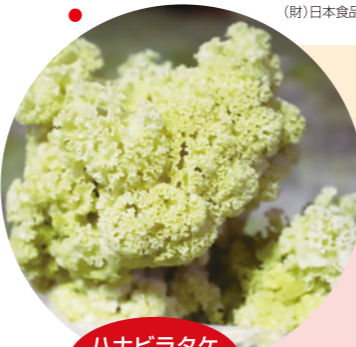
ハナビラタケ(洞窟で栽培)